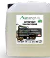
NETTOYANT DÉCAPANT AGRIMAT À 15

Nettoyant décapant puissant certifié ECOCERT. Conçu pour éliminer les salissures graisseuses, les traces de pneus, de cires de polymères.