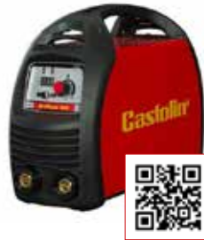
POSTE CASTOARC ONDULEUR 180A