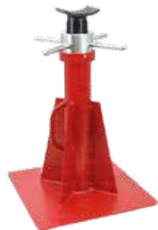
CHANDELLE À VIS 20 T