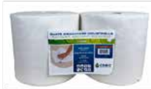
BOBINE BLANCHE T1000 F

Lot de 2 bobines ouate blanche T1000F - 2 plis - point à point 24 x 26.