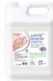
NETTOYANT MAINS D'ATELIER 5 L

Nettoyant à base de glycérine végétale et de micro-billes naturelles. Élimine traces de cambouis, encres, goudrons, peintures, poussières.