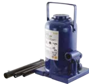
CRIC BOUTEILLE 30 T